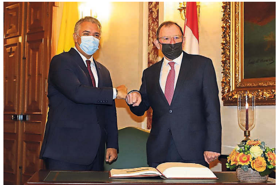
Le Président de la Colombie a effectué une visite à la Chambre des Députés.

Le Président de la Colombie a invité le Président de la Chambre des Députés à se joindre à un prochain voyage diplomatique en Colombie.