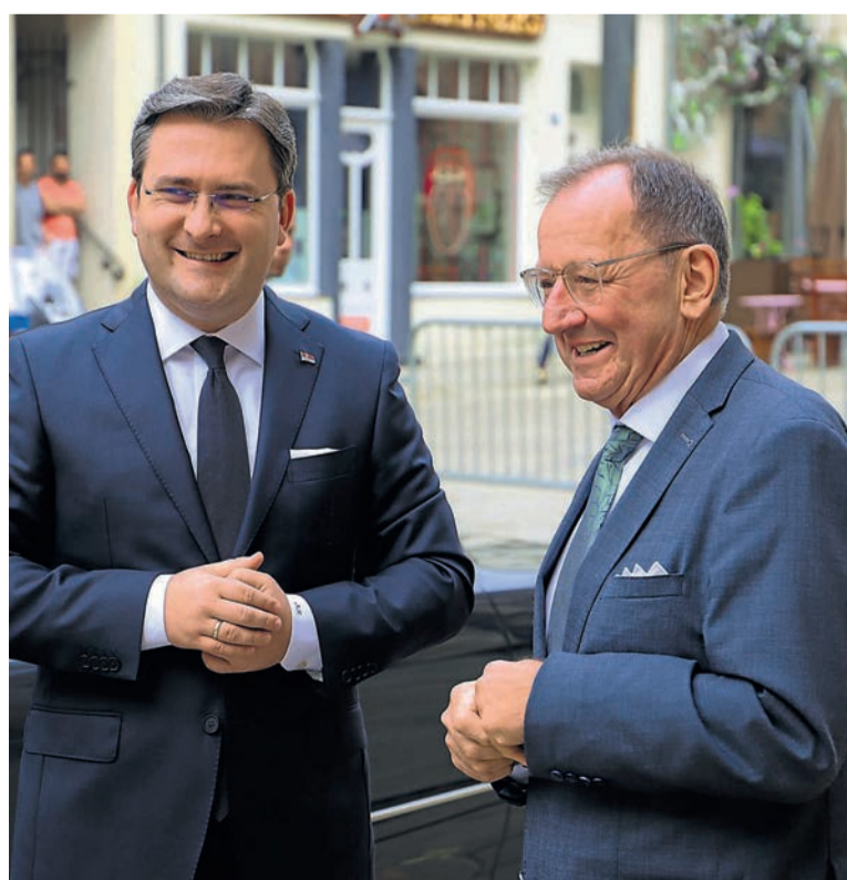
Le Ministre des Affaires étrangères serbe, M. Nikola Selaković, reçu par le Président de la Chambre, M. Fernand Etgen.

Les relations entre les Républiques de Serbie et du Kosovo ainsi que l'initiative « Open Balkan » qui vise à promouvoir un marché unique entre la Serbie, la Macédoine du Nord et l'Albanie furent également traitées.