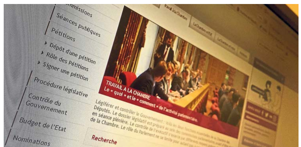
L'affichage erroné concernait uniquement le site chd.lu et non le site dédié petitionnen.lu .

La Chambre des Députés tient à remercier l'utilisateur qui a signalé le problème et à présenter ses excuses à toute personne dont les informations personnelles ont pu être exposées par erreur.