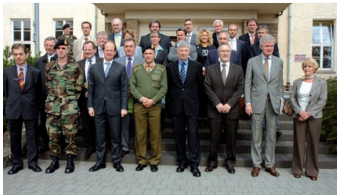
Die Vertreter der parlamentarischen Ausschüsse für Verteidigung und öffentliche Bauten wurden im Militärzentrum auf Herrenberg von Bautenminister Claude Wiseler und Armeeminister Jean-Louis Schiltz empfangen.

Eine weitere, nicht unwesentliche Phase sieht die Neuorientierung der 34 Pavillons vor, von denen man 23 behalten möchte. Da man das für die Renovierung von drei Pavillons vorgesehene Budget von 7,5 Millionen Euro aber bereits an nur zwei Objekten fast aufgebraucht hatte, will man sich nun überlegen, ob ein Neubau nicht vielleicht preiswerter zu haben ist.