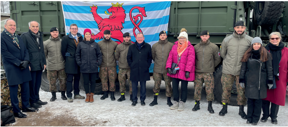
La délégation luxembourgeoise a été reçue par les soldats luxembourgeois déployés en Lituanie au sein d'une mission de l'OTAN.

battre). Cependant, si la mission dissuasive échoue, le bataillon est pleinement capable de répondre sur le terrain à des menaces stratégiques concrètes pour le territoire qu'il défend. À cet égard, a souligné le Lieutenant-Colonel, il ne s'agit pas d'une mission d'entraînement, mais bien d'un bataillon opérationnel.