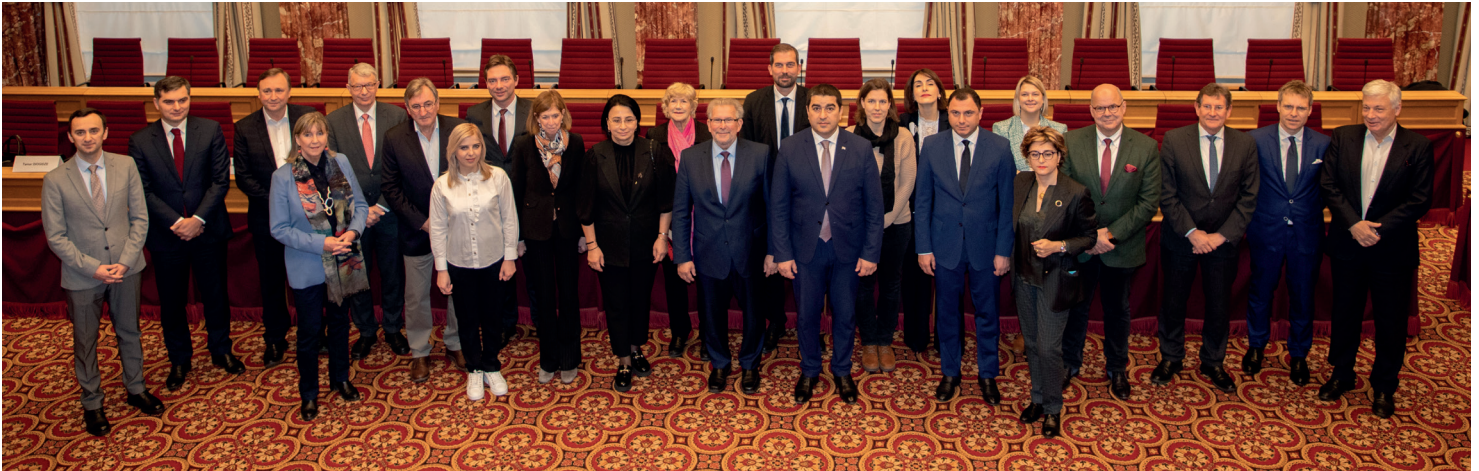
Les députés luxembourgeois ont accueilli leurs homologues géorgiens à l'Hôtel de la Chambre.

« La Géorgie se sent liée à l'Europe de manière étroite et se définit en tant que contributeur à la culture européenne », a déclaré le Président du Parlement géorgien, M. Shalva Papuashvili, lors d'une entrevue avec des députés du Bureau et de la Commission des Affaires étrangères et européennes, de la Coopération, de l'Immigration et de l'Asile le 7 décembre 2022.