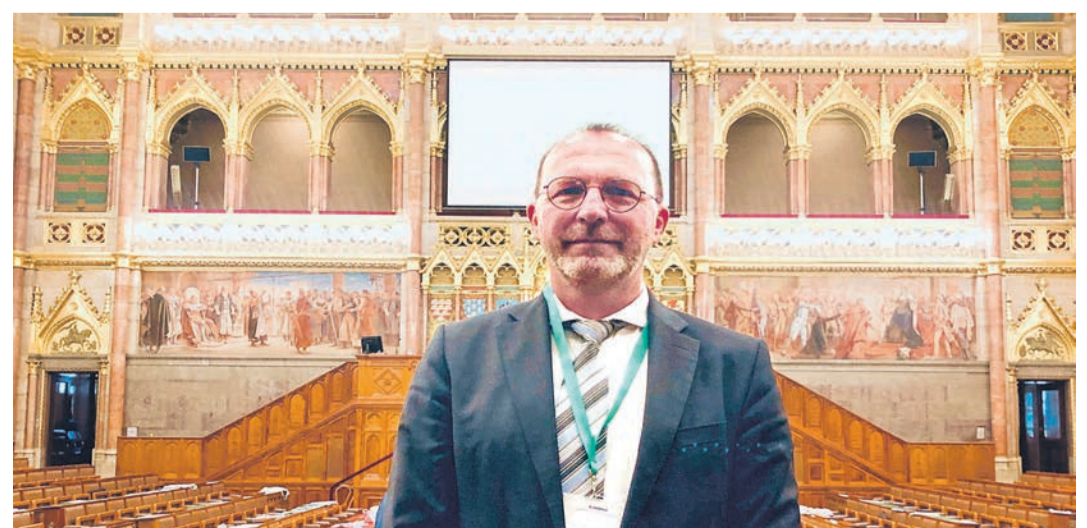
M. Georges Engel, membre de la Commission de contrôle parlementaire du Service de renseignement de l'État, a représenté la Chambre des Députés au forum parlementaire sur le renseignement et la sécurité à Budapest.

La prochaine conférence du forum parlementaire aura lieu à Washington D.C.