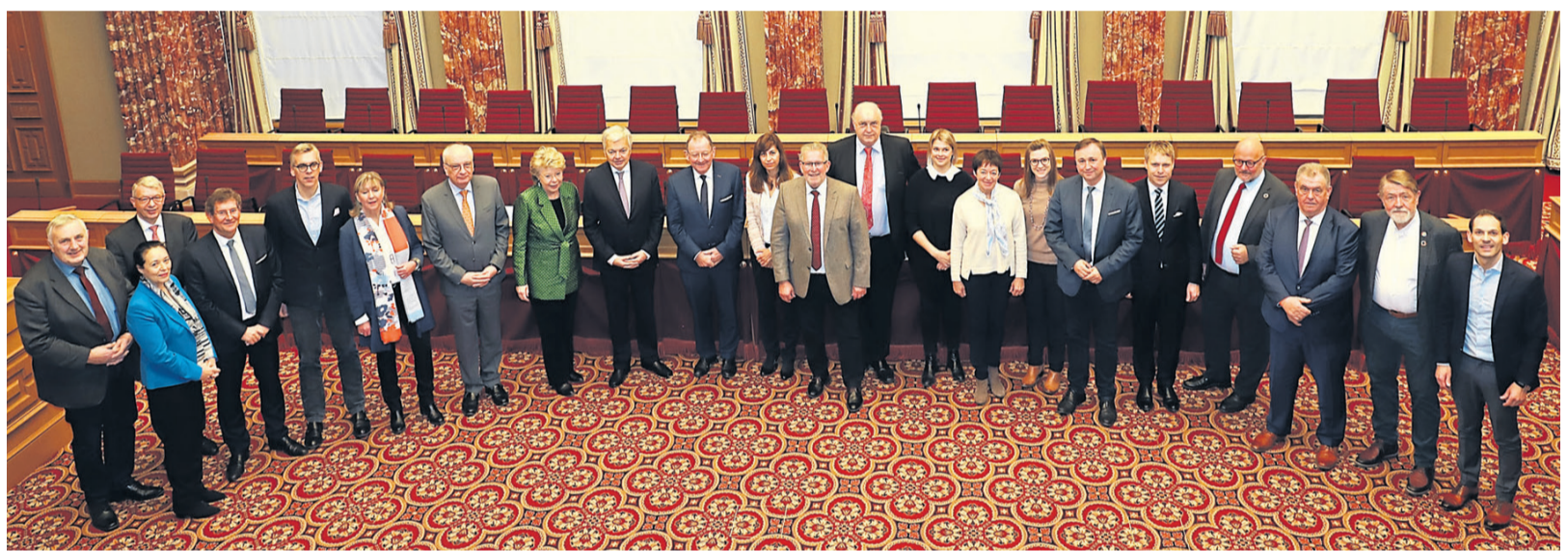
Le Commissaire européen à la justice, M. Didier Reynders, entouré de députés nationaux et européens luxembourgeois

La situation du Luxembourg concernant l'État de droit sera discutée au niveau européen au cours du