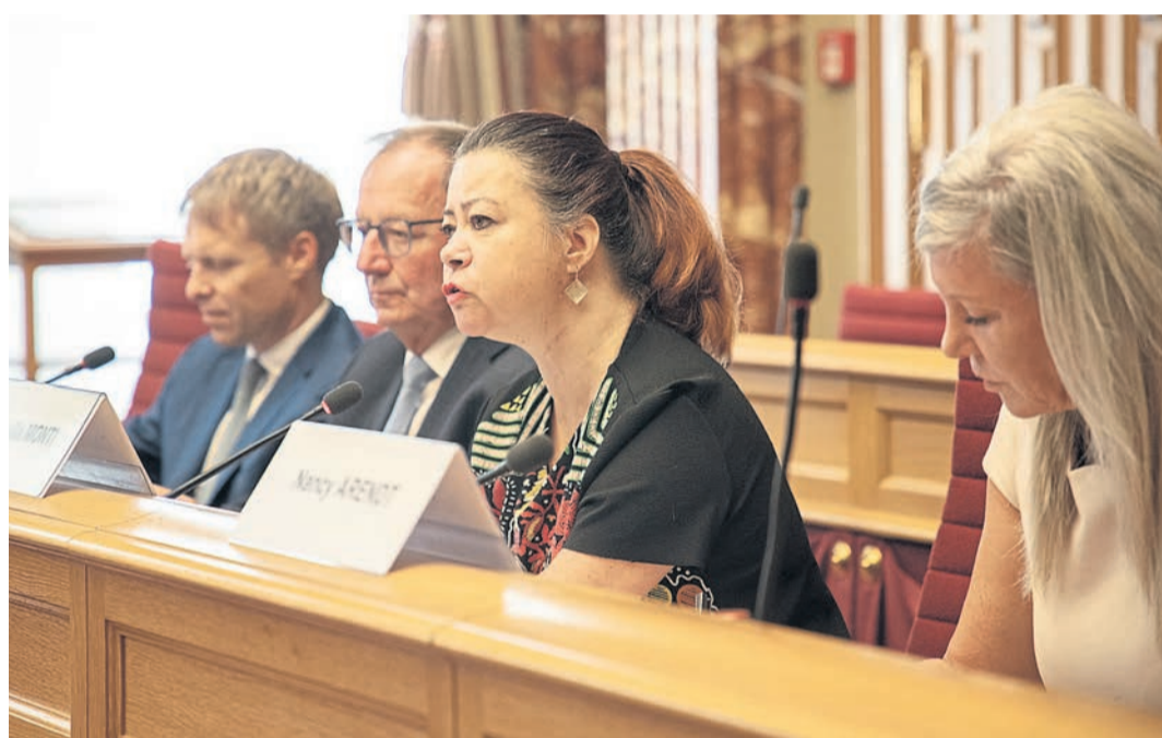
L'Ombudsman, Mme Claudia Monti (au milieu), lors de la présentation de son rapport annuel 2021 à la Chambre des Députés

La médiatrice formule trois recommandations dans son rapport qui visent à adapter les dispositions légales pour éviter certains litiges. Elle recommande ainsi d'inclure la comaternité et la copaternité dans la loi, de modifier les dispositions rela-