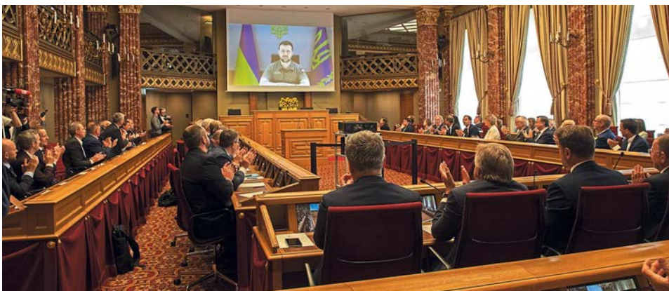
Après son intervention devant le Parlement et le Gouvernement luxembourgeois, le Président ukrainien, M. Volodymyr Zelensky, fut applaudi par l'assemblée.

« Mir wëlle bleiwe wat mir sinn ». C'est avec ces mots que le Président ukrainien, M. Volodymyr Zelensky, s'est adressé aux députés luxembourgeois et aux membres du Gouvernement par visioconférence lors de la séance publique du 2 juin 2022, dans le cadre de la guerre qui oppose l'Ukraine à la Russie.