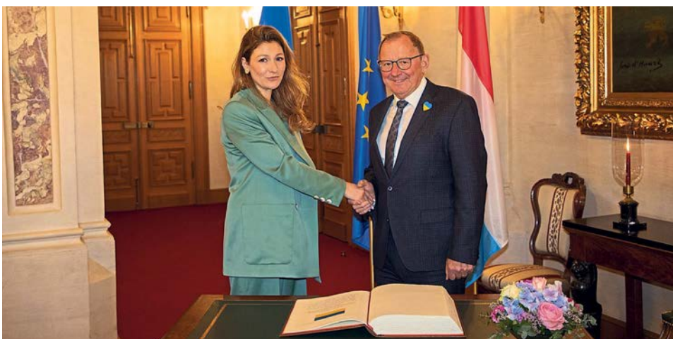
La Vice-Ministre des Affaires étrangères de la République d'Ukraine, Mme Emine Dzhaparova, était en visite à la Chambre des Députés.

100 jours après l'invasion russe en Ukraine, la Vice-Ministre des Affaires étrangères de la République d'Ukraine, Mme Emine Dzhaparova, était en visite à la Chambre des Députés le 3 juin 2022 pour une entrevue