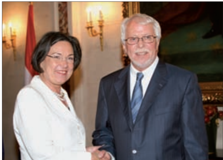
La Présidente de la Chambre des Représentants des Pays-Bas, Mme Gerdi A. Verbeet, reçue par le Président de la Chambre des Députés, M. Lucien Weiler.

«L'Union européenne est et restera la meilleure enceinte pour sauvegarder les intérêts des petits pays.»