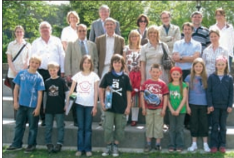
D'Membere vun der Éducatiounskommissioun hunn d'Buerglënster Primärschoul besicht.