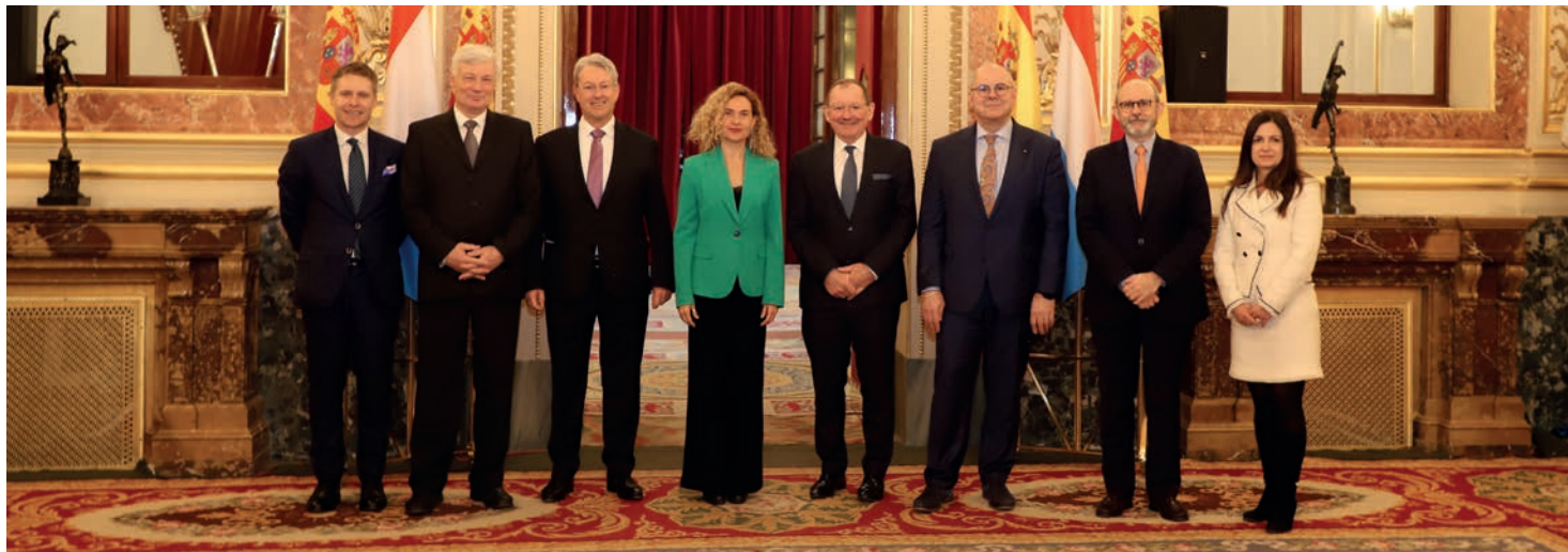
La délégation parlementaire luxembourgeoise a été reçue par la Présidente du Congrès des Députés espagnol, Mme Meritxell Batet (au milieu).