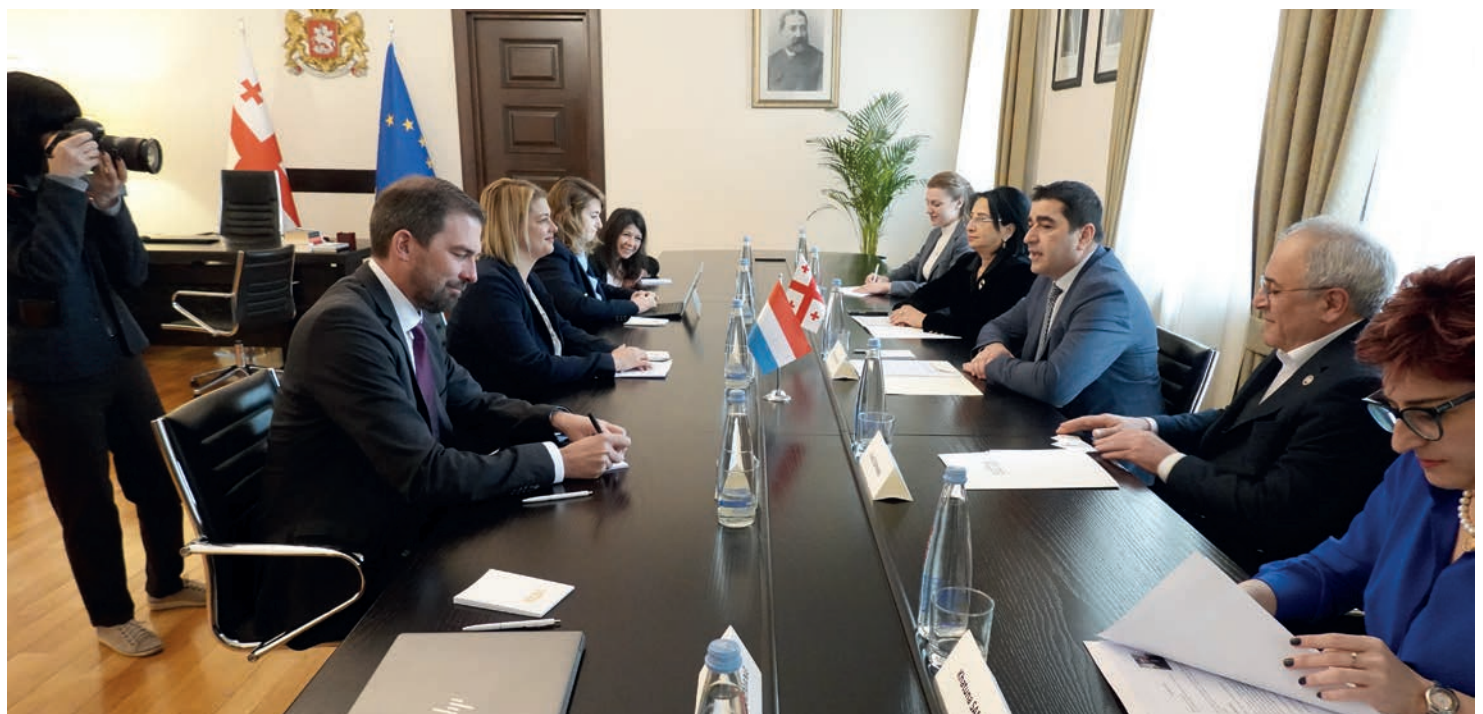
Le Président du Parlement géorgien, M. Shalva Papuashvili (au milieu à droite), a reçu les députés luxembourgeois.

Un membre des services de sécurité a expliqué la situation actuelle aux députés, soulignant que la Russie se sert notamment de la détention illégale de personnes arrêtées dans la zone de séparation pour faire pression sur la Géorgie.